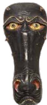
馬面／静岡浅間神社所蔵