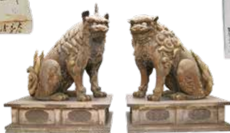
狛犬 伝左甚吾郎作 家光奉納 ／静岡浅間神社所蔵