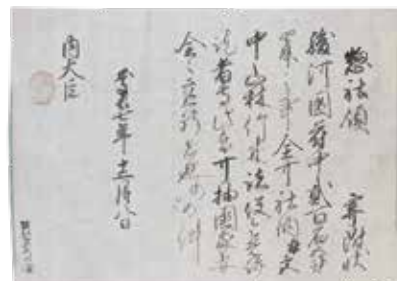
徳川家康朱印状(惣社宛) ／静岡浅間神社所蔵