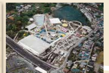
空から見た狐ヶ崎ヤングランド