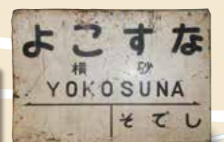
駅名標(横砂)