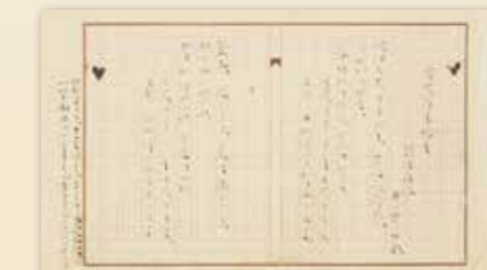
北原白秋自筆 歌詞原稿(ちゃっきりぶし) 1927(昭和2)年(静岡鉄道株式会社所蔵)

1927(昭和2)年の狐ヶ崎遊園の開園を記念して、そのテーマソングとして制作されたのが、ちゃっきりぶしです。静岡を代表する郷土民謡となるよう、北原白秋に作詞を依頼し、作曲を町田嘉章が担当しました。高度経済成長を果たした1968(昭和43)年に、狐ヶ崎遊園は狐ヶ崎ヤングランドとしてリニューアルオープンしました。デンマーク・コペンハーゲンの「チボリ公園」を模して造られ、ボウリング場に加えて、夏季はプール、冬季はスケートの営業も行い、多くの人びとで賑わいました。