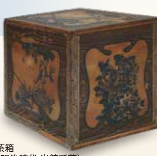
茶箱 (明治時代 当館所蔵)

静岡茶は、長旅による品質の劣化を防ぐために、茶箱に詰められ海外に輸出されました。茶箱の外側には茶箱絵が貼られ、カラフルに装飾されて、人びとの眼を楽しませました。輸出先は、米国が大半を占めました。